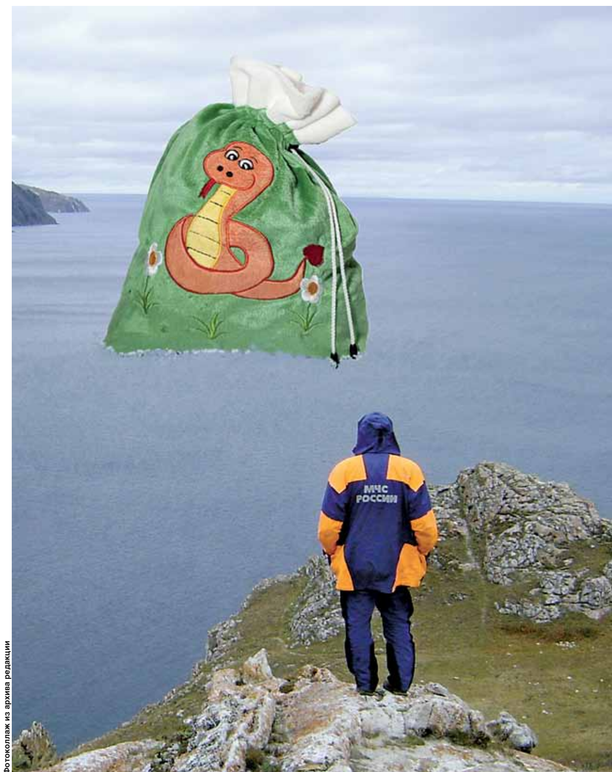
Фотоколлаж из архива редакции

Накануне новогодних праздников, 30 декабря, был подписан Федеральный закон «О социальных гарантиях сотрудникам некоторых федеральных органов исполнительной власти и внесении изменений в отдельные законодательные акты Российской Федерации». Этот документ устанавливает некие социальные гарантии сотрудникам федеральной противопожарной службы.