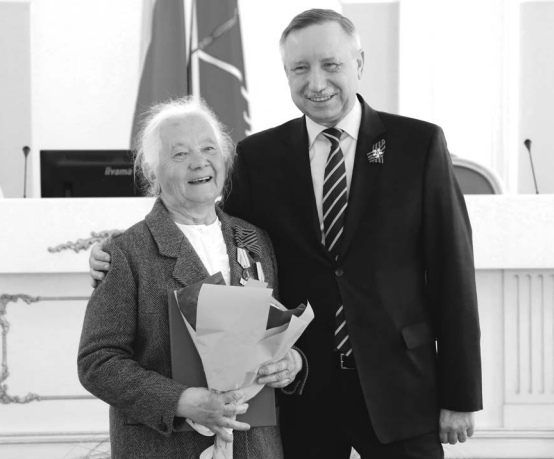
Врио губернатора Санкт-Петербурга Александр Беглов: «В первую очередь новое жилье получат блокадники».

В 2019 году в Санкт-Петербурге планируется расселить более трех тысяч коммунальных квартир и предоставить их жильцам социальные выплаты на сумму 2,7 миллиарда рублей, сообщили в жилищном комитете правительства города. В 2018 году было расселено 3,7 тысячи коммунальных квартир, в настоящее время их количество составляет 69 тысяч. В коммуналках до сих пор проживает 229 тысяч семей, из них 81 тысяча семей состоит на учете в качестве нуждающихся в улучшении жилищных условий. Всего за период действия программы «Расселение коммунальных квартир в Санкт-Петербурге», с 2008 года, улучшены жилищные условия 106 тысяч семей, расселено 47 тысяч коммунальных квартир. Еще 29,5 тысячи семей оказано содействие в улучшении жилищных условий путем предоставления социальных выплат.