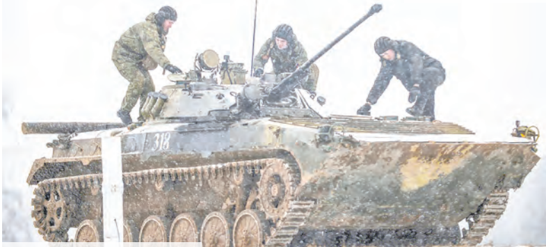
По команде: «К бою!»

Около 1,5 тыс. военнослужащих вышли на полигоны для проведения тренировок с боевой стрельбой из стрелкового оружия и боевых машин пехоты БМП-2 и БМП-3.