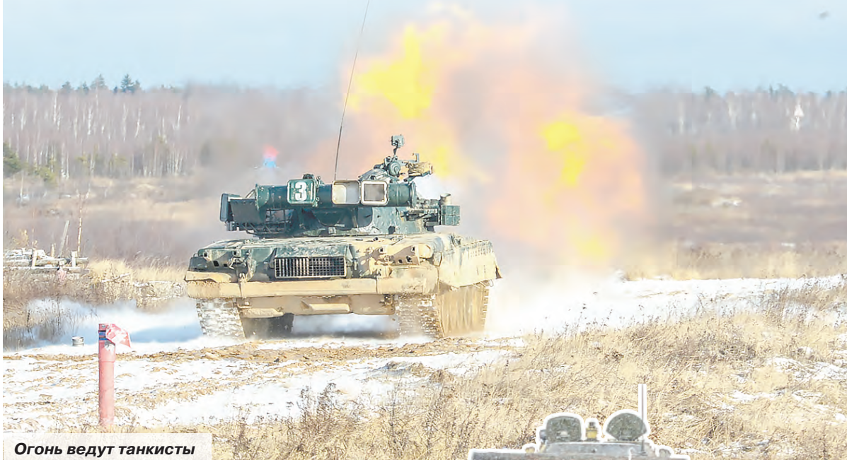
Огонь ведут танкисты

На полигонах Алабино, Головеньки и Мулино в Московской и Нижегородской областях прошли боевые стрельбы мотострелковых и танковых подразделений гвардейской танковой армии ЗВО.