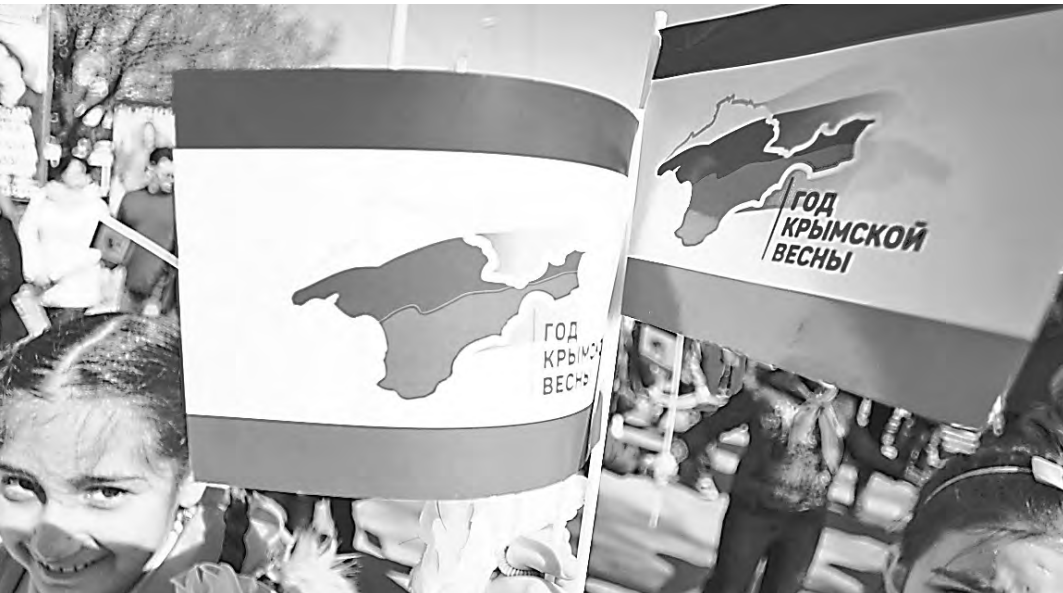
16 марта останется в памяти крымчан и войдет в учебники истории.

Елена Гусакова, «Российская газета», Симферополь