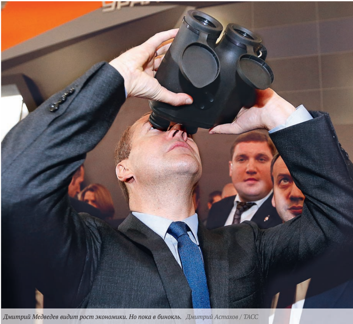
Дмитрий Медведев видит рост экономики. Но пока в бинокль.

В Государственной Думе готовятся поправки к законам «О потребительском кредитовании» и «О микрофинансовой деятельности и микрофинансовых организациях». В них потолок ставки по займам, предоставляемым микрофинансовыми организациями, ограничивается 150% годовых. По данным ЦБ, сейчас среднерыночные ставки микрозаймов в России составляют 599,3%, предельные значения достигают 799%.