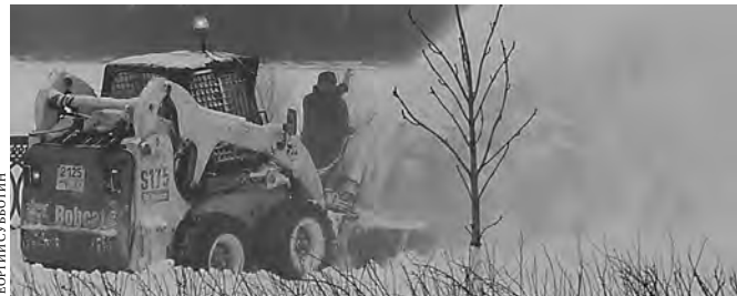
Вместо 120 машин на улицы выехали только... 32.