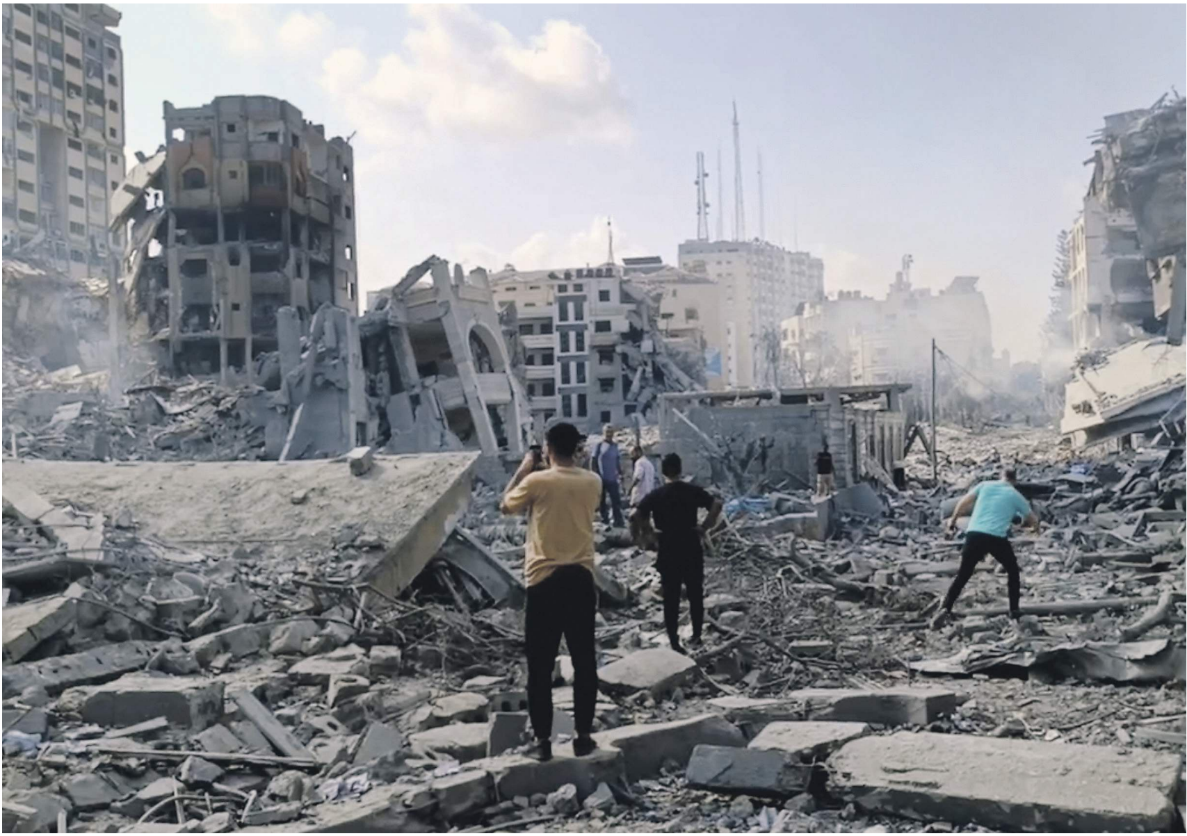
Израиль, МСБМ и «Известия»

Сирены звучали во многих городах Израиля — Тель-Авиве, Ашдоде, Ашкелоне, у других населённых пунктов на границе сектора Газа. Представители военного крыла ХАМАС анонсировали крупный обстрел Ашкелона и призвали жителей города покинуть его до 17.00 (время совпадает с московским).