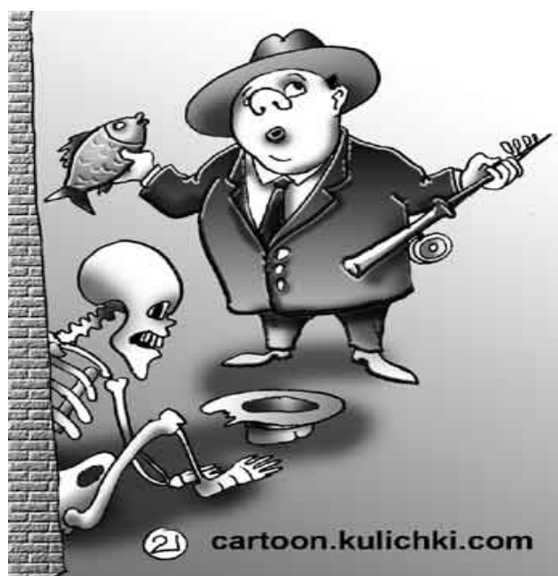
«Так как же все-таки формировать местные бюджеты?»