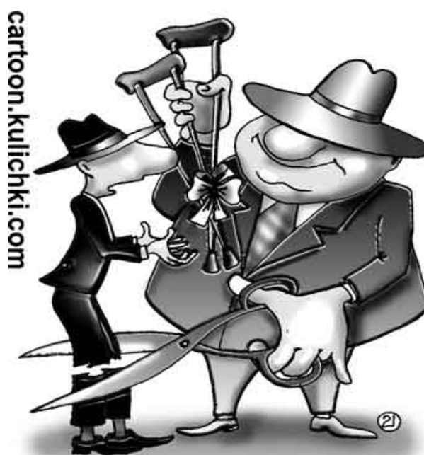
«Формирование межбюджетных трансфертов по-русски»