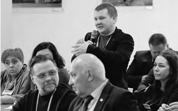
Представителей власти и «антимусорных» движений собрала Общественная палата Поморья.

В Петербурге собираются легализовать граффити. Соответствующий законопроект принят в первом чтении. Все изображения художникам придется согласовывать с комитетом по градостроительству и архитектуре. Обсуждается возможность выделения в городе нескольких свободных зон специально для стрит-арта.