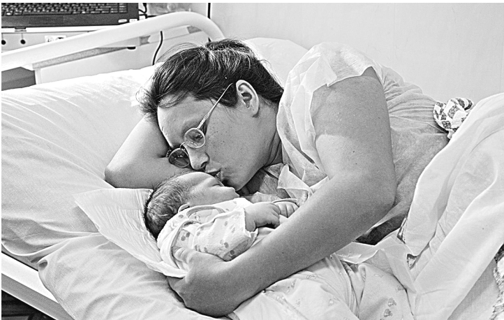
В 2015 году рождаемость в Самарской области побила рекорд десятилетия.