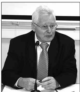
С.Г. Кара-Мурза, доктор химических наук