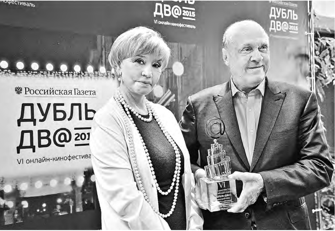
Лауреаты премии «За выдающийся вклад в кинематограф» Владимир Меньшов и Вера Алентова.