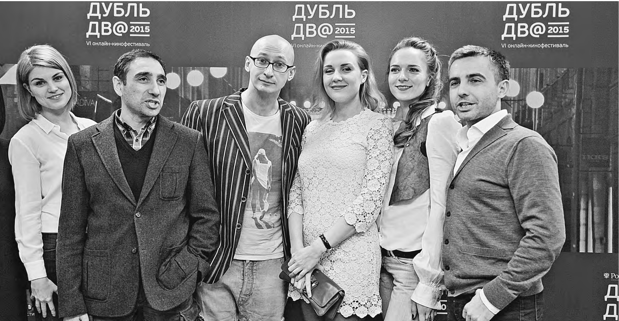
Фестиваль «Дубль дв@» украсила своим присутствием съемочная группа фильма «Репетиции».