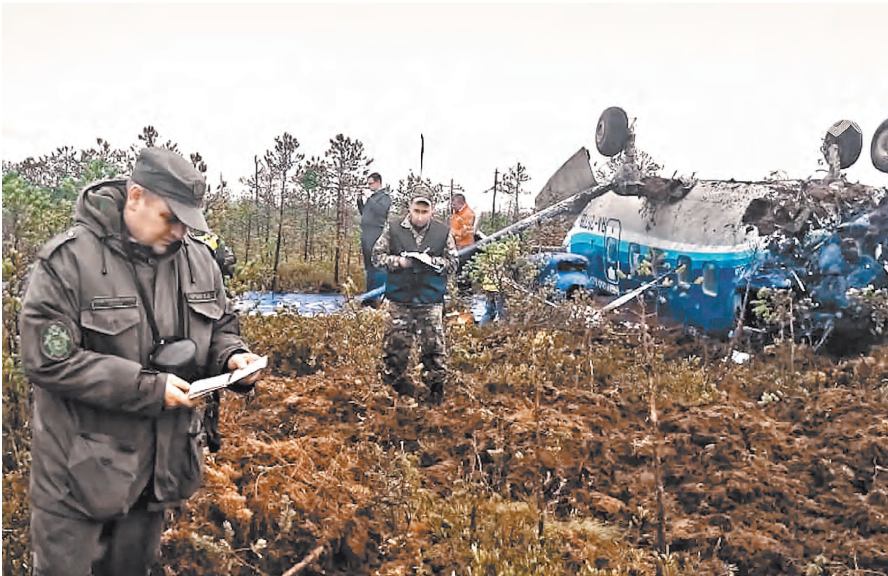
ЗАПАДНО СИБИРСКОЕ СЛЕДСТВЕННОЕ УПРАВЛЕНИЕ НА ТРАНСПОРТЕ СК РФ

Наталья Граф, «Российская газета», Томск