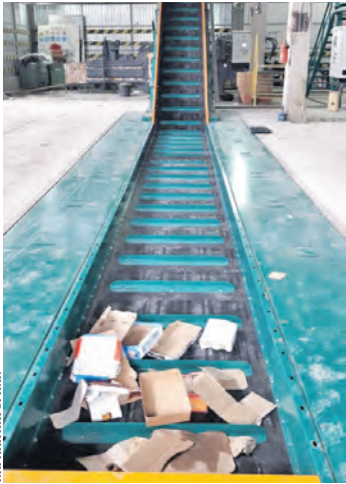
Линия для сортировки мусора уже смонтирована.

— После сортировки отходов на полуавтоматическом ком-