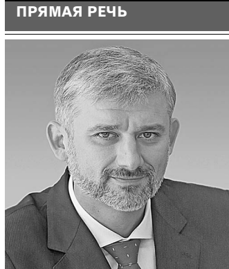
Евгений Дитрих, министр транспорта РФ:

В конце ноября Минтранс РФ презентовал интерактивную карту, которая наглядно демонстрирует ход работ и промежуточные итоги реализации БКАД. По данным этого сервиса, субъектов СЗФО в списках отстающих нет. Всего же, по информации федерального министерства, к концу ноября в «зоне риска» находились шесть российских регионов.