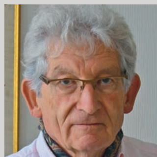
ПРИНЦИП АРРИВ ЖАН-ПЬЕРА АРРИНЬОНА