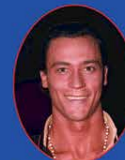
Бронзовый призер International 2012, чемпионатов мира, чемпион России среди профессионалов Сергей Сурков