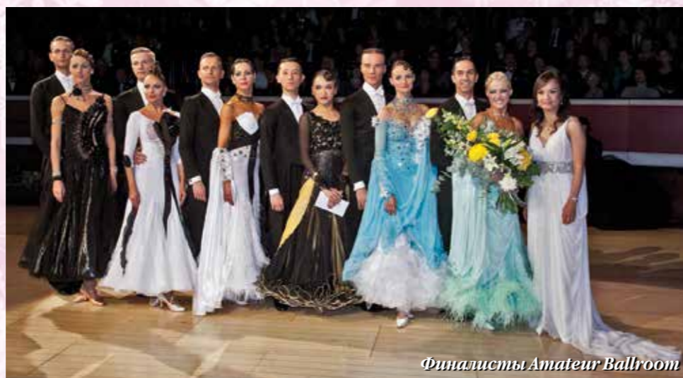
Финалисты Amateur Ballroom

студиях города, на практиках и уроках с ведущими педагогами. И вот наступают главные дни – отборочные туры в Брентвуде, где только 50-60 пар в основных категориях получают заветный билет в Королевский Альберт Холл. Здесь же, в Брентвуде завершаются соревнования для ювеналов, юниоров, молодежи и сеньоров, а также турниры “Rising Stars” среди профессионалов. Как всегда, результаты в Англии интересны и непредсказуемы. И с этим можно спорить или соглашаться, но тем не менее нельзя не относиться с уважением к мнению тех, кто стоит в судейской панели на этих соревнованиях. В последние годы бригада арби-