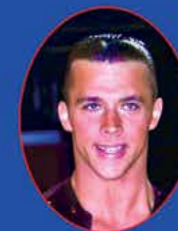
Чемпион Мира, многократный чемпион России среди любителей Андрей Зайцев