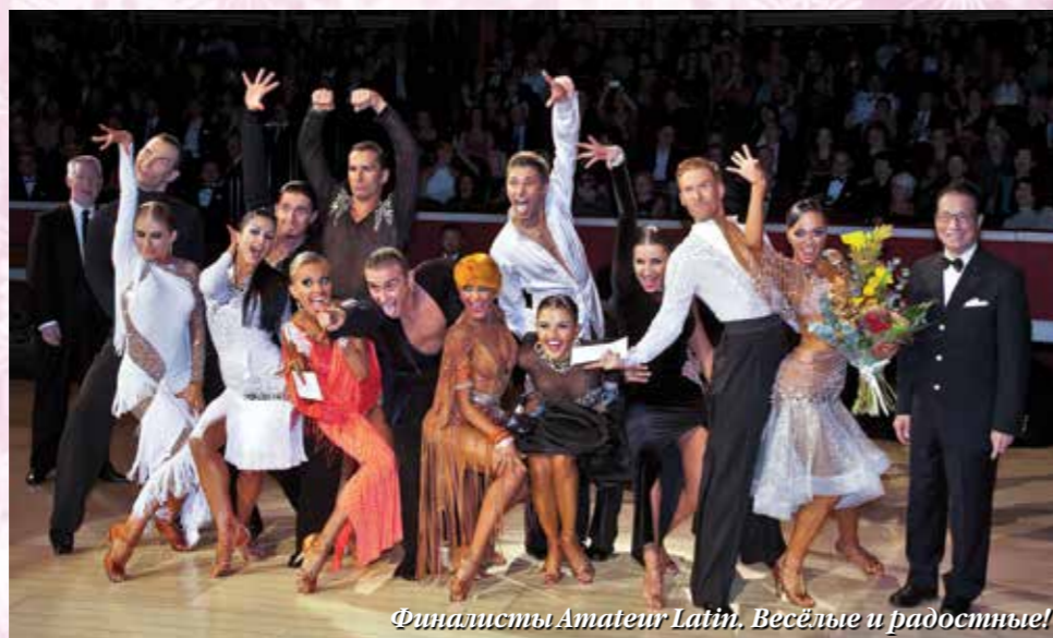
Финалисты Amateur Latin. Весёлые и радостные!

Начало октября в Лондоне проходит под знаком International Championships один из трех крупнейших турниров в Англии и один из самых престижных в мире, он ежегодно собирает танцоров со всех уголков мира, от юниоров до профессионалов. Кроме того, за многие годы основной турнир «оброс» турнирами-спутниками, которые проходят до и теперь уже и после основного чемпионата. Некоторые пары используют эту возможность, чтобы лишний раз почувствовать друг друга в соревновательной ситуации, показать себя зрителям и судьям и еще раз встретиться со своими соперниками. А кто-то предпочитает продолжать подготовку в танцевальных