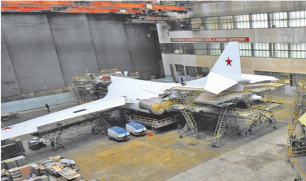
Стратегический бомбардировщик в цехе Казанского авиазавода.

Одна из приоритетных задач Минобороны – совершенствование Воздушно-космических сил