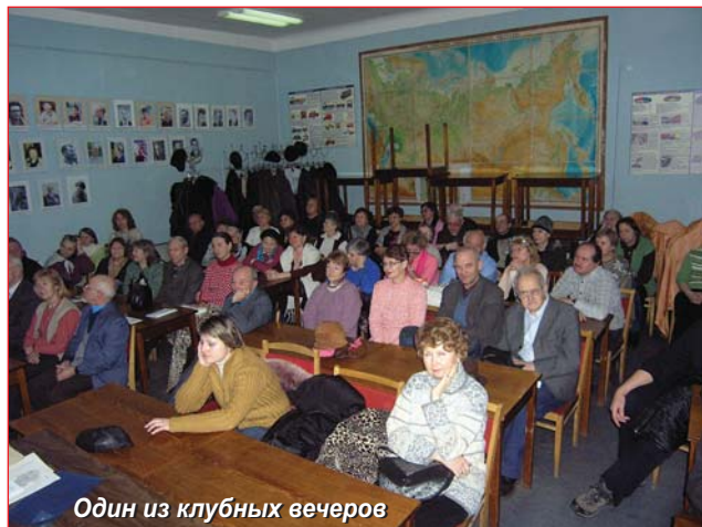
Один из клубных вечеров