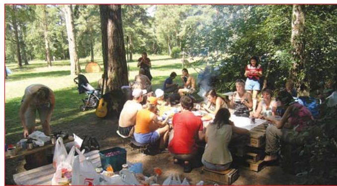
В походах выходного дня