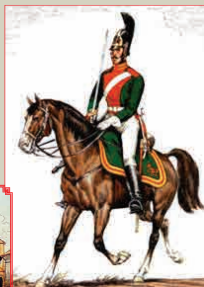
Рядовой лейб-гвардии Драгунского полка

Гвардейские конноегеря в Новгороде Рис. Н. САМОКИША