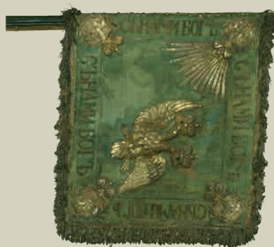
Штандарт лейб-гвардии Драгунского полка