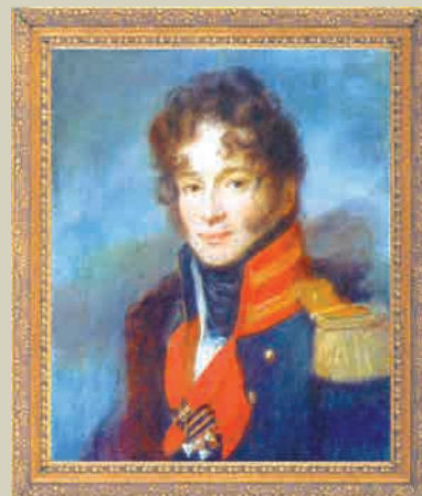
Портрет командира лейб-гвардии Драгунского полка П.А. Чичерина Художник А.Г. ВЕНЕЦИАНОВ

Знак в память шефства над лейб-гвардии Драгунским полком великого князя Владимира Александровича. Утверждён в 1912 г. Из частного собрания