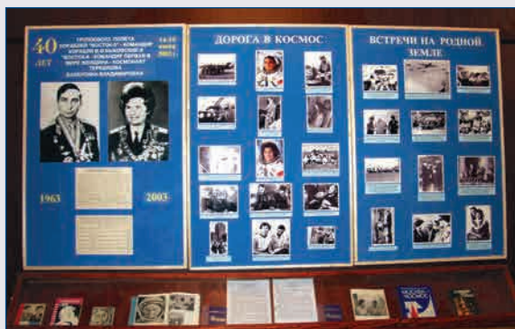
Выставка, посвящённая 40-летию полёта в космос В.В. Терешковой и В.Ф. Быковского