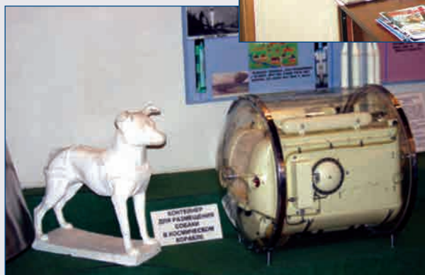
Макет контейнера с системой жизнеобеспечения для размещения собаки в космическом корабле