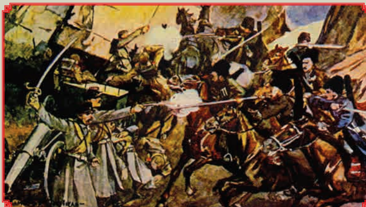
Новачинский бой 10 ноября 1877 г.