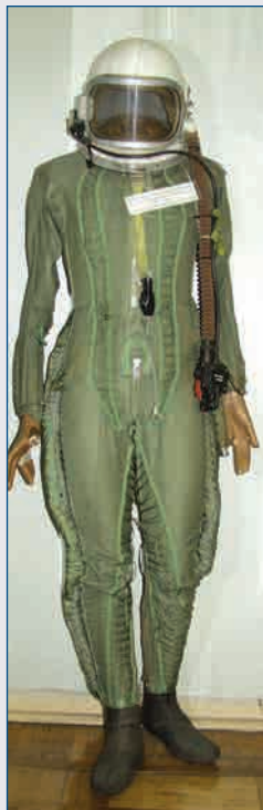
Высотно-компенсационный костюм лётчика 1960-е годы