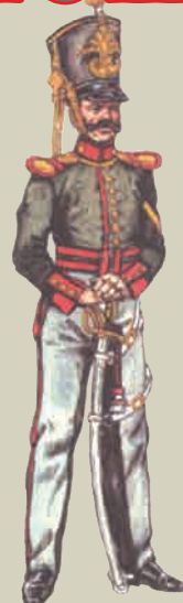
Рядовой Московского драгунского полка 1835 г.