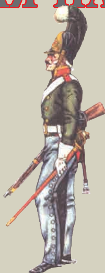
Унтер-офицер Харьковского драгунского полка 1812 г.