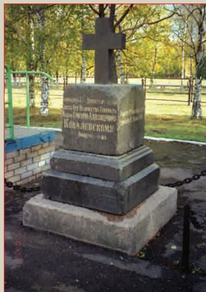
Памятник командиру лейб-гвардии Драгунского полка Г.А. Ковалевскому в Кречевицах Современный вид