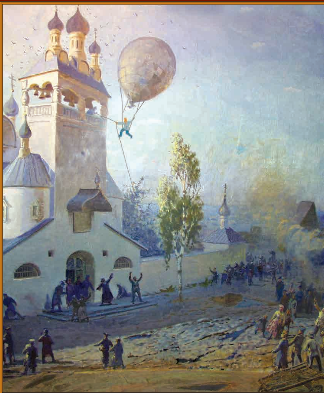
Полёт на воздушном шаре в г. Рязани в 1753 г.