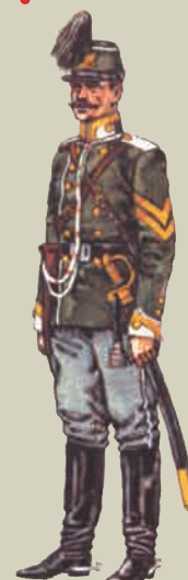
Вахмистр Каргопольского драгунского полка 1877 г.