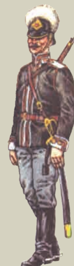
Рядовой 13-го драгунского Военного ордена полка 1913 г.