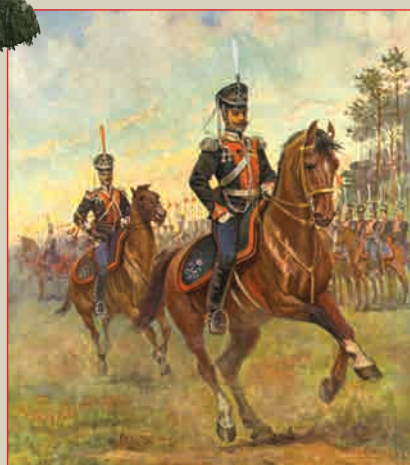
Лейб-гвардии Драгунский полк 1914 г. Почтовая карточка начала XX века