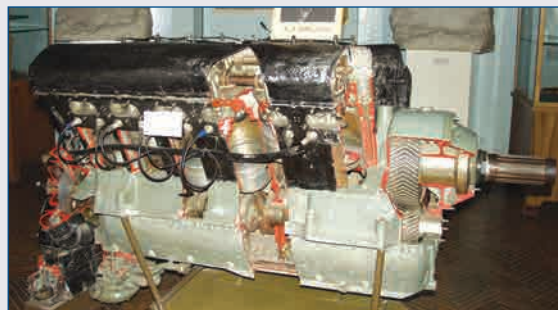
Двигатель М-34РНА конструктора А.А. Микулина