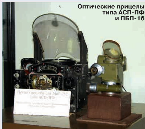
Оптические прицелы типа АСП-ПФ и ПБП-16