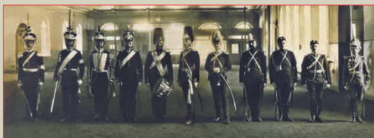
Столетие лейб-гвардии Драгунского полка. Группа чинов полка в исторических мундирах 1914 г.