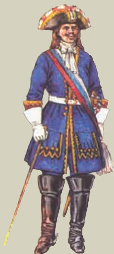
Офицер драгунского полка 1710 г.