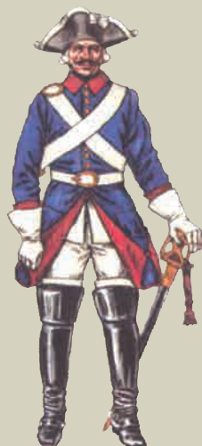
Рядовой драгунского полка 1756—1761 г.