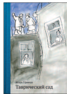
Таврический сад/Игорь Ефимов. – М.: Самокат, 2012. – 152 с. – (Родная речь)

Мальчик Гена решил сделать подарок своей воспитательнице к Новому году и начинает вести дневник. Детсадовский философ описывает события и дает им свою оценку. Взрослые со всей своей педагогикой и методикой порой забывают о том, какими наблюдательными бывают дети. И как иногда стоит прислушаться к «младенцу», чтобы посмотреть на себя со стороны и посмеяться от всей души вместе с ним. Мы говорим своим детям, что «детский сад – это тоже работа». Книга Станислава Востокова – своего рода ответ ребенка на наши педагогические ухищрения, прямой, честный и очень смешной. И небольшая передышка в деле взаимного воспитания.