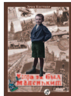
Когда я был маленьким/Эрих Кестнер. – М.: Самокат, 2012. – 272 с. – (Другое детство)

Откуда берутся сказочники? Что ставляет людей придумывать самые невероятные истории? Особый склад ума? Избыток фантазии? Жизненные обстоятельства? Известный педагог Анатолий Цирульников убежден: сказочник живет в душе у каждого. И если дочка просит: «Папа, расскажи...», ей нельзя отказывать. «Бамс!» – это старая сказка, пересказанная на новый лад. Это книга о постепенном становлении маленького человека и об удивительных людях, сочинивших для нас лучшие сказки. А «бамс» – это то, что случилось однажды с ними, когда они вдруг решили писать для детей.