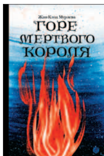
Горе мертвого короля/Жан-Клод Мурлева. – М.: Самокат, 2012. – 376 с. – (Встречное движение)

Знаменитый немецкий писатель Эрих Кестнер (1899–1974), лауреат золотой медали имени Андерсена (1960), принадлежит к числу лучших взрослых, которые никогда не перестают быть детьми. В повести «Когда я был маленьким» он рассказывает юным читателям о своем детстве так увлекательно и живо, что мы смеемся и плачем вместе с маленьким Эрихом, переживаем за его первый учебный день, несемся с горы на велосипеде вслед за ним и его кузиной. И кажется, что все это случилось сейчас и с нами, а не сто лет тому назад в далеком Дрездене. Книга оригинально оформлена с использованием рисунков, карт и открыток начала XX века.