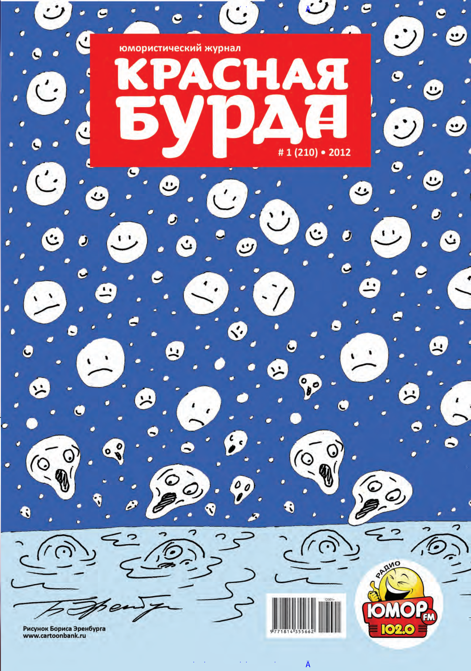
Рисунок Бориса Эренбурга www.cartoonbank.ru