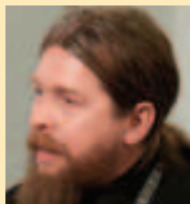
2 июля Шевкунова Георгия Александровича (отца Тихона), писателя