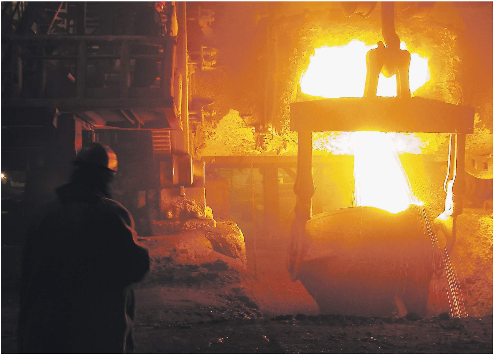
Олег Падурей / Иллюстрация