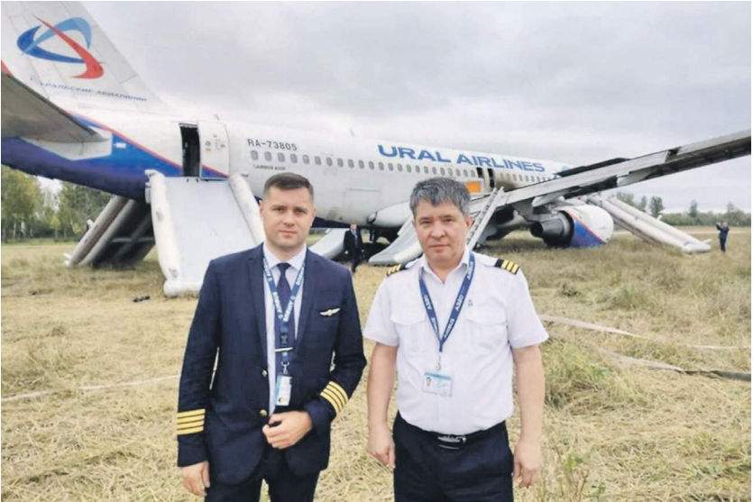
Г. ИАС. Россия / Новосибирская область