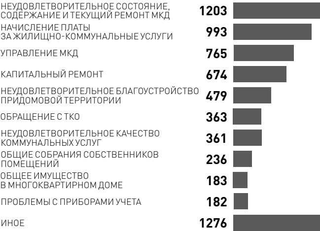
ИНФОГРАФИКА: РГ. / УЛьяНА ВЫЛЕГЖАНИНА, АННА ДУРОВА

ОБРАЩЕНИЯ ГРАЖДАН РФ В 3-м КВАРТАЛЕ 2019 ГОДА, единицы Источник: НП «ЖКХ Контроль»