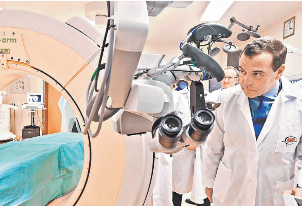
Дмитрий Медведев: Не считаю возможным экономить на здоровье граждан.

С этого года в программу диспансеризации включен ряд нововведений. В частности, будут проводиться исследования, которые на ранних стадиях позволяют выявить серьезные заболевания кровообраще-