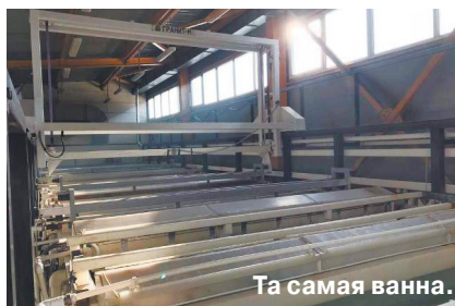
Та самая ванна.

— судя по всему, производственно работник сделал глупок. В срочном порядке пострадавший отправился в душевую, где смыл с себя остатки раствора. Также коллеги помогли больному промыть желудок водой, но с течением времени мужчине