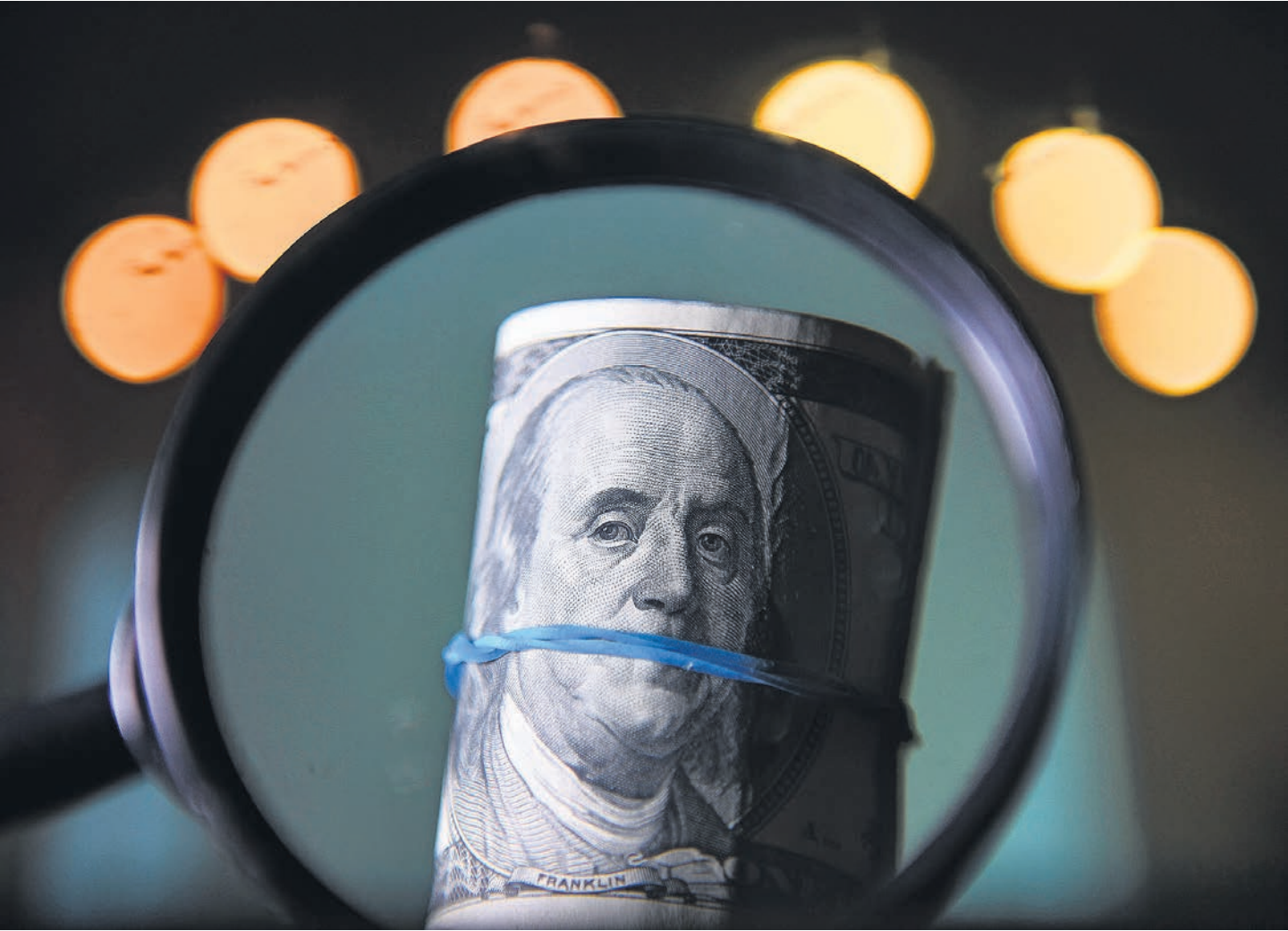
Несмотря на сильный рубль, ограничения на внешние валютные операции не предполагается отправлять в архив

По крайней мере, именно так выглядит первый пункт указа №430. В подпункте А уточняется, что требования статьи 19 ФЗ-173 от 10 декабря 2003 года «О валютном регулировании и валютном контроле» исполняются в размере, установленном правительственной комиссией по иноинвестициям, и в срок, установленный ЦБ. Технически это временная отмена обязательной репатриации валютной выручки — срок репатриации сейчас вообще неважен, поскольку норматив продажи валютной выручки — 0%. В какой мере ЦБ и Минфин, де-факто контролирующей комиссией, готовы постоянно держать норматив и сроки нулевыми, на деле неизвестно и, видимо, зависит от обстоятельств курсообразования и от конструкции будущих «бюджетных правил». Подпункт В гораздо более определен и точно не в русле отмены валютного контроля — он, отвечая на многочисленные вопросы резидентов, определяет, что средства дивидендов АО и распределенной прибыли ООО, товариществ и производственных кооперативов РФ в валюте за пределы страны перечислять запрещено. Наконец, пункт 2 предоставляет правительственной комиссии полномочия ограничивать по своему усмотрению перевод валюты на свои иностран-