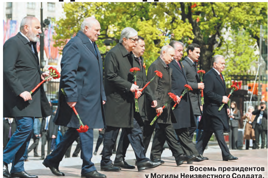
Восемь президентов у Могилы Неизвестного Солдата.

Депутат Затулин оценил приезд семи лидеров стран СНГ: «Успех Путина»