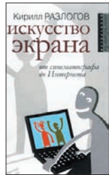
Разлогов К. Искусство экрана: От синемафотографа до Интернета. М.: Российская политическая энциклопедия, 2010. — 304 с. — (Актуальная культурология).

6 Искусствовед и кинокритик Кирилл Разлогов рассказывает об экранном искусстве во всем его историческом многообразии — и о художественных феноменах, которые оно породило и продолжает порождать. Простым киноманам, телезрителям и юзерам это исследование будет не менее интересно, чем специалистам.