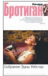
Бротиган Р. Собрание Эдны Уэбстер / Пер. с англ. М. Немцова. СПб.: Азбука-классика, 2010. — 208 с.

7 Давным-давно, когда Ричард Бротиган еще не был классиком американской прозы и идиолом контркультуры, он оставил на хранение матери своей первой возлюбленной, Эдне Уэбстер, несколько рукописей, сказав: «Когда я стану богатым и знаменитым, Эдна, это будет ваша социальная страховка». Недавно эти рукописи нашли, опубликовали — и очень приятно удивились.