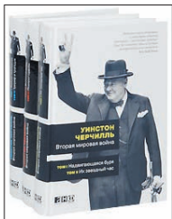
Черчилль У. Вторая мировая война / В 6 томах (комплект из 3 книг). М.: Альпина нон-фикшн, 2010. — 2128 с.

4 К 65-летию Победы российский читатель может порадовать себя внушительным подарочным изданием одного из известнейших трудов по истории борьбы антигитлеровской коалиции против фашизма — грандиозной «Второй мировой войны» Уинстона Черчилля.