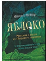
Фейбер М. Яблоко: Рассказы о людях из «Багрового лепестка» / Пер. с англ. С. Ильина. М.: Машины творения, 2010. — 208 с.