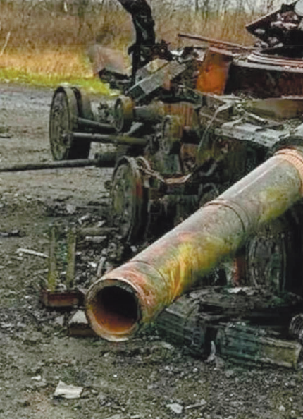
А Российская армия с успехом их уничтожает.