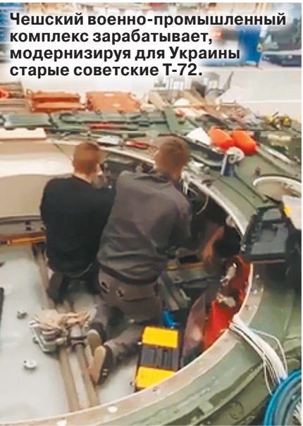
Чешский военно-промышленный комплекс зарабатывает, модернизируя для Украины старые советские Т-72.