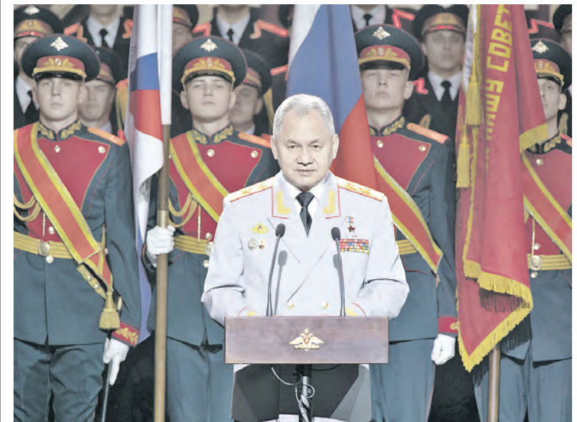
Генерал армии Сергей Шойгу поздравил сотрудников и ветеранов газеты «Красная звезда».

Рядом с титулом газеты начертан обращённый к защитникам Родины девиз: «Мы храним тебя, Россия!»