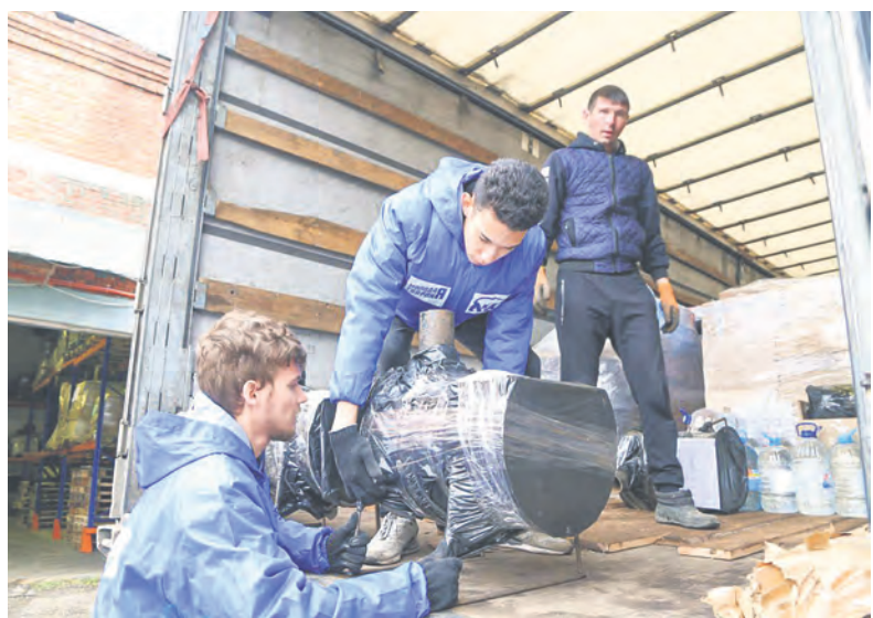
Очередной гуманитарный конвой уезжает на передовую.

Северяне продолжают вкладывать силы, энергию и время в помощь участникам специальной военной операции