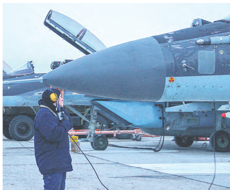
Проводится предполётная подготовка.

Плановые полёты в отдельном корабельном истребительном авиационном полку (ОКИАП) из-за погодных условий отменили. Синоптики выдали неутешительный прогноз: мороз и высокая влажность грозили обледенением крылатых машин в воздухе, что могло иметь нежелательные последствия.