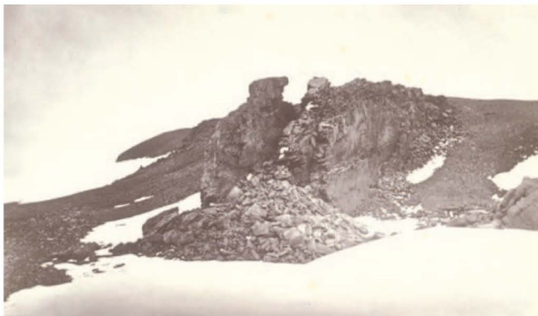
Продовольственное депо в августе 1872 года.

Экипаж судна тылового обеспечения Северного флота "Эльбрус" с большой долей вероятности обнаружил место продовольственного депо австро-венгерской экспедиции 1872-1874 годов Карла Вайпрехта и Юлиуса Пайера.