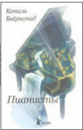
Бьёрнстад К. Пианисты: Роман / Пер. с норв. Л. Горлиной; Ил. И. Донца. М.: КомпасГид, 2011. — 352 с.: ил.

1 Пластинки, которые выпустил известный пианист, композитор и музыкальный критик Кетиль Бьернстад, пересчитать так же сложно, как книги, которые он за свою жизнь написал: рассказы и стихи, биографии и пьесы. Этот роман, рассказывающий о любви и музыке в жизни молодого пианиста, создан как будто на двух языках: норвежском и нотном.