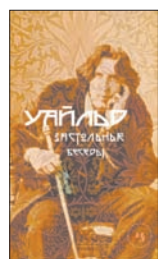
Уайльд О. Застольные беседы: Т. 1 / Пер. с англ. Е.Осенева. М.: Иностранка, 2011. — 336 с.

5 Знакомьтесь с неканоническим Оскаром Уайльдом! В сборнике «Застольные беседы» литературовед Томас Райт собрал и снабдил подробными комментариями записи устных рассказов британского классика, поражающие современников чуть ли не больше, чем опубликованные произведения Уайльда.