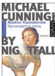
Каннингем М. Начинается ночь / Пер. с англ. Д. Веденяпина. М.: Corpus, 2011. — 352 с.

4 Одни говорят: красота спасет мир, другие считают, что красота — начало ужаса. Главный герой нового романа Майкла Каннингема — галерист Питер Харрис, отчаянно пытающийся выжить в мире победившего китча, — будет вынужден проверить на собственной шкуре оба эти утверждения. И оба они, что интересно, окажутся верными.