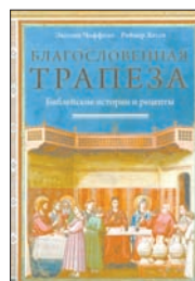
Чиффоло Э., Хессе Р. Благословенная трапеза: Библийские истории и рецепты / Пер. с англ. Н.Цыркун. М.: Колibri, Азбука-Аттикус, 2011. — 386 с.

7 У людей не осталось ничего святого! Ну как это — миндально-кокосовое печенье в шоколаде от царя Давида? На самом деле, авторы этой книги — священник Рейнер Хессе и историк Энтони Чиффоло — читали священные тексты очень внимательно, выискивая не только рецепты блюд, что готовили Иаков с Марией, но и проверяя все на практике.