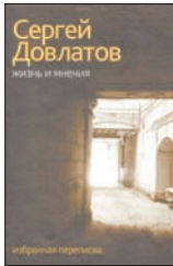
Довлатов С. Жизнь и мнения: Избранная переписка. СПб.: Звезда, 2011. — 384 с.