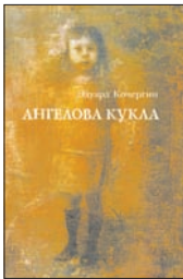
Кочергин Э. Ангелова кукла: Рассказы рисовального человека. СПб.: Вита Нова, 2011. — 448 с., 54 ил.

2 Главный художник Большого драматического театра им. Товстоногова — здесь он «кочерга», который терпит выходыки «паханцов» в художественной школе, мирится с причудами декораторов в Театре драмы, вспоминает, как жили после войны, и — как может один художник — расписывает «богемную чашу алкашного человечества». В сборник Кочергина включены семь новых, прежде не выходивших рассказов.