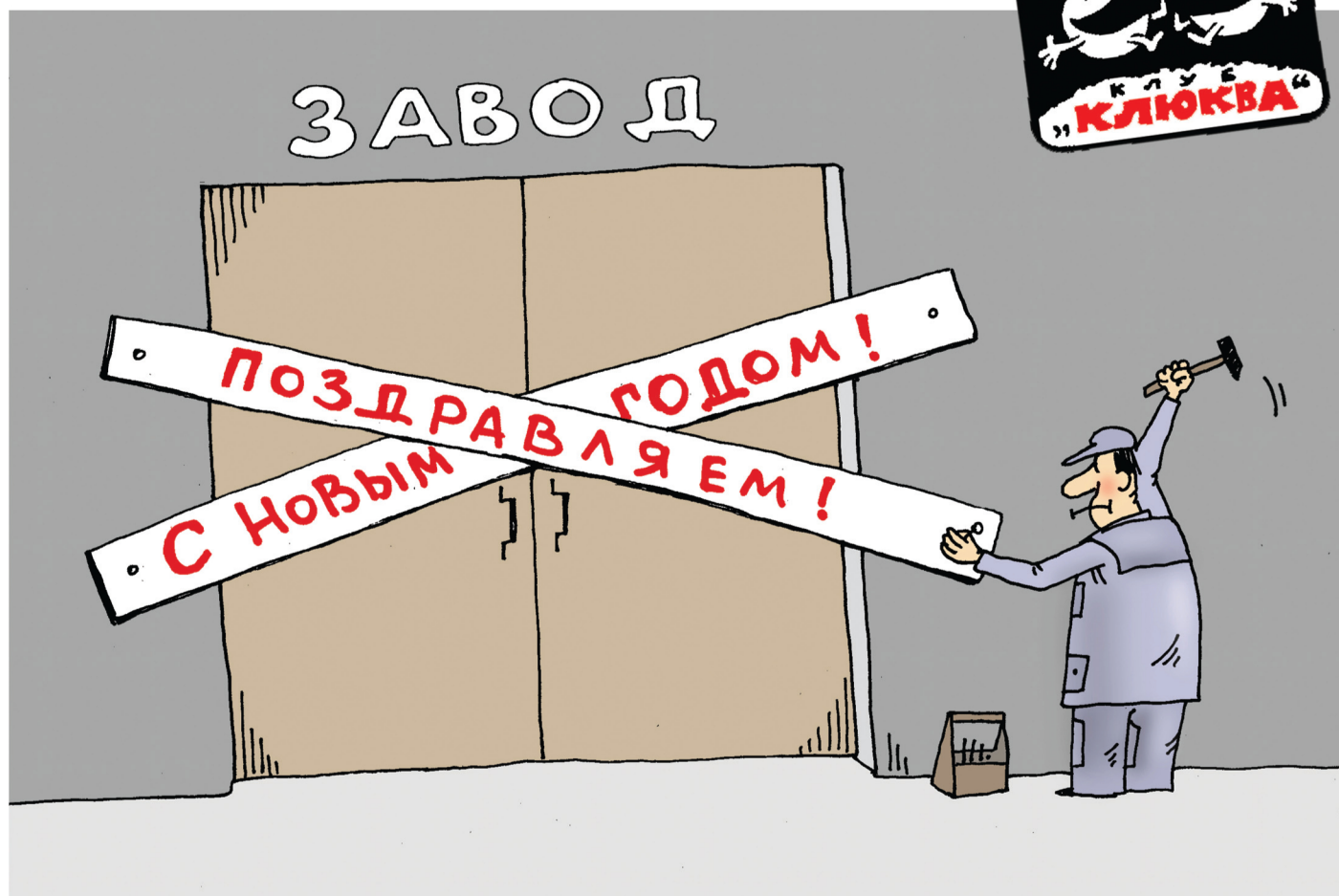
Рисунок Валерия Тарасенко