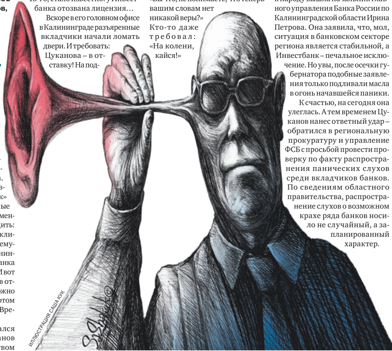
иллюстрация Саша Нук