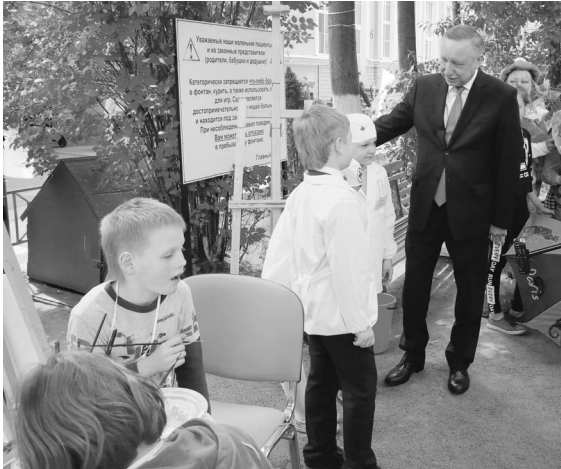
Врио губернатора Александр Беглов проинспектировал работу больницы.

Строительство нового лечебного корпуса детской больницы Святой Марии Магдалины должно завершиться до 2021 года. Такую задачу поставил временно исполняющий обязанности губернатора Санкт-Петербурга Александр Беглов профильному комитету, посетив медицинское учреждение. Напомним, что больница — многопрофильный стационар на Васильевском острове для детей и подростков в возрасте до 18 лет — была открыта 24 октября 1829 года. Средства, позволяющие в 2019 году приступить к строительству нового корпуса больницы, были предусмотрены губернаторской поправкой к бюджету Санкт-Петербурга на 2019—2021 годы.