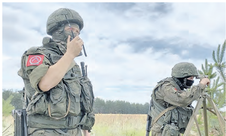
Российские артиллеристы всегда в готовности

Характерные черты наших доблестных воинов, отважно сражающихся и выполняющих задачи специальной военной операции, – беззаветное мужество, негибаемая воля, гранитная твёрдость духа и непоколебимая решимость