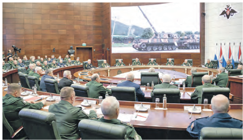
Идёт заседание Коллегии Минобороны России