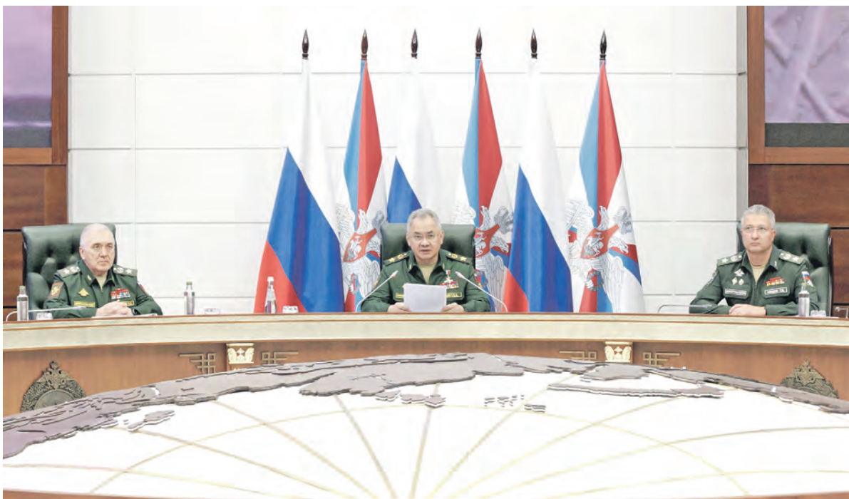
Министр обороны России генерал армии Сергей Шойгу пояснил необходимость создания новых военных округов

При этом Соединённые Штаты неуклонно повышают ставки, добиваясь от союзников поставок