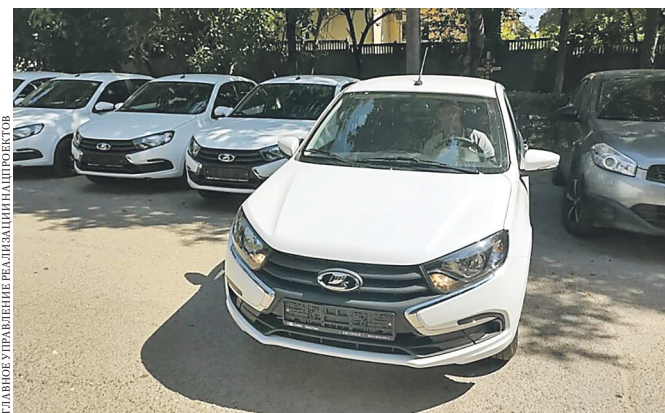
Больницы Крыма получили новые машины. Обновить автопарк смогли 19 медучреждений.