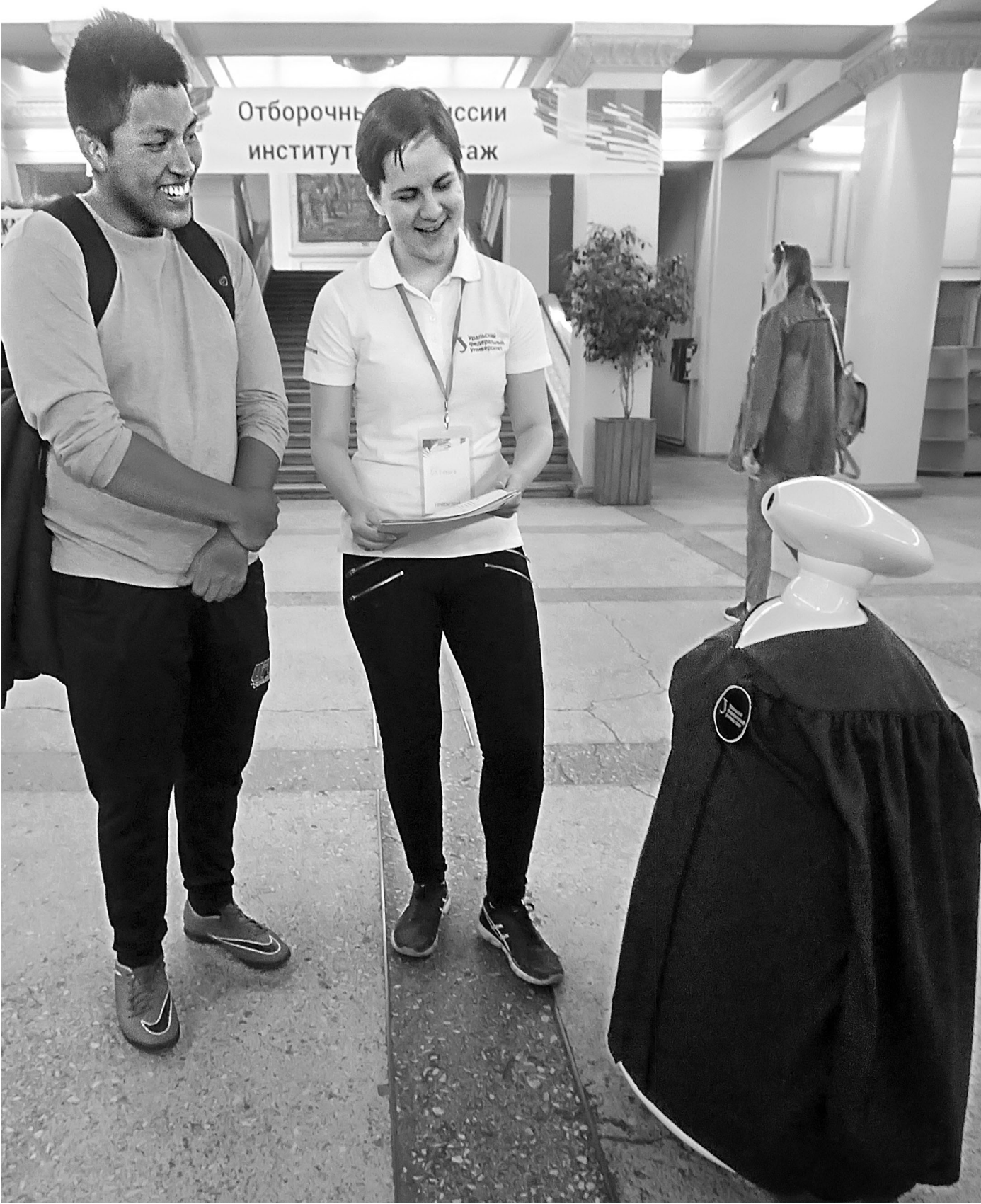
Робот-андرويد работает «на подхвате» в приемной комиссии УрФУ: он помогает абитуриентам сориентироваться в огромном количестве специальностей.

ТЕМА НЕДЕЛИ Разделение молочных полок пока оборачивается массовой профанацией