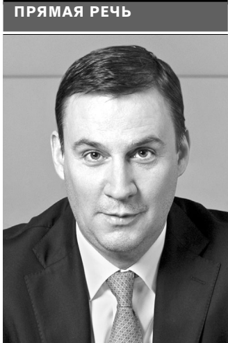
Дмитрий Патрушев, министр сельского хозяйства Российской Федерации:

то человек, боясь купить продукт с пальмовым маслом, вообще отказывается от молочного. И это огромная проблема. По словам эксперта, сейчас на прилавках по-прежнему велика доля фальсифицированных масла и сыров—до трети всей продукции. Эти данные подтверждает и Россельхознадзор. —Разделение продукции на прилавках пойдет параллельно с введением электронной системы ветерсертификации «Меркурий»,—продолжает Копытов,—с 1 июля она уже обязательна для сгущенного молока, сливок, масла, сыров, а с 1 ноября коснется питьевого молока, мороженого и кисломолочной продукции. Система позволяет отследить весь путь продукта, от производителя до прилавка, а значит, исключить скрытое использование заменителей. Все эти меры должны привести к тому, что недобросовестные производители уйдут с рынка либо вынуждены будут продавать молоко с добавками по его реальной цене. К слову, эксперты считают: если рынок будет сбалансирован, натуральная продукция и ее многочисленные «копии» займут отдельные ниши, роста цен не произойдет. ●