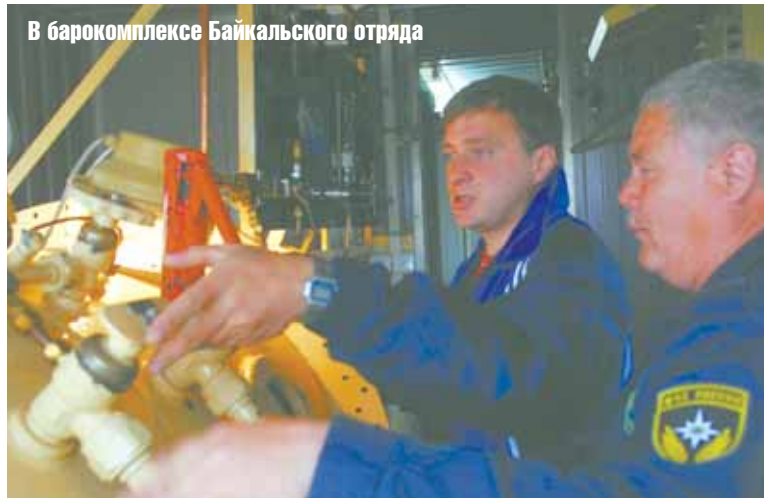
В барокомплексе Байкальского отряда