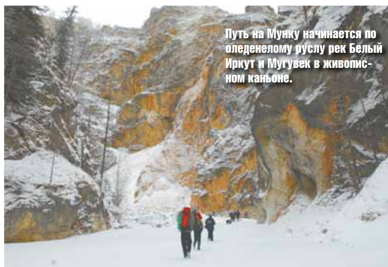
Путь на Мунку начинается по оледенелому руслу рек Белый Иркут и Мугуев в живописном каньоне.