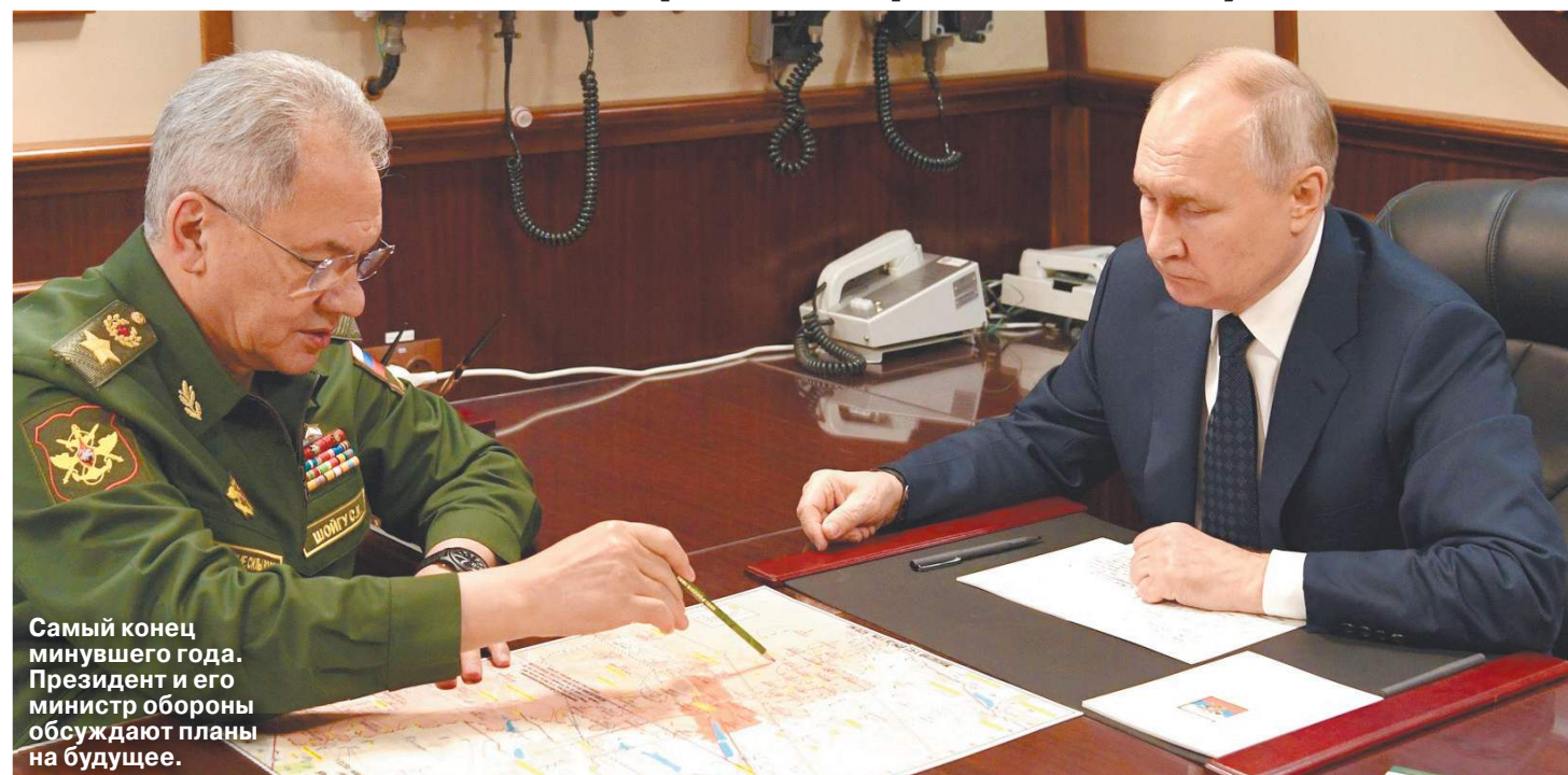
Самый конец минувшего года. Президент и его министр обороны обсуждают планы на будущее.

Эксперт Тимофей Бордачев обозначил козыри Путина и неожиданные риски для Кремля в 2024 году