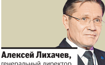
Алексей Лихачев, генеральный директор госкорпорации «Росатом»:

ТАКТИЧЕСКОЕ учение белорусских и российских десантников прошло на полигоне «Брестский». Основная фаза учения прошла в три этапа, в нем участвовало около 900 военнослужащих наших стран и более 150 единиц техники. Российские и белорусские десантники совместно отработали навыки ведения контрдиверсионных действий по обнаружению, блокированию и уничтожению незаконных вооруженных формирований в приграничной зоне Союзного государства.