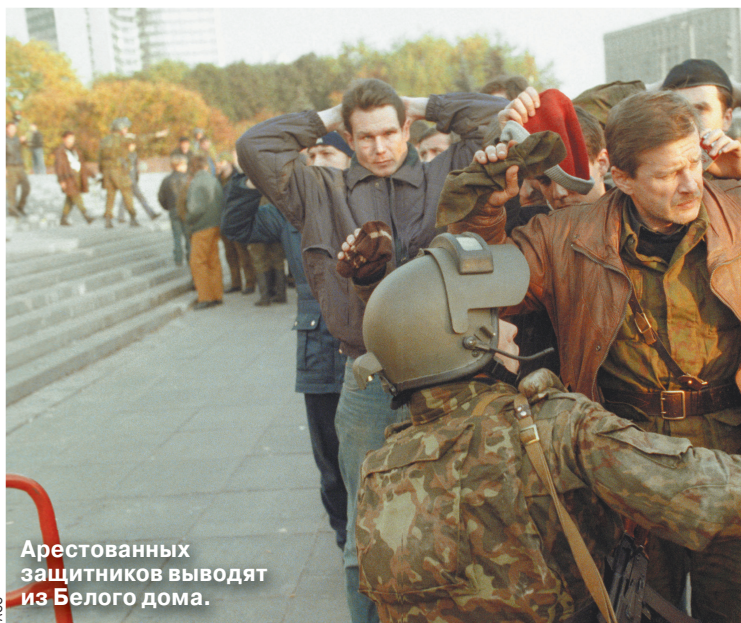
Арестованных защитников выводят из Белого дома.