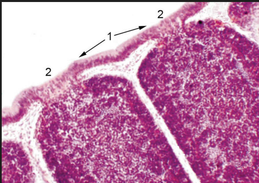
Рис. 1. Интерфолликулярный (1) и фолликул-ассоциированный эпителий (2) складок бursы Фабрициуса. Возраст 30 дней. Гематоксилин-эозин. \times 10 , \times 20

Иллюстрации к статье Турицыной Е. Г. «Морфологические особенности фабрициевой бursы цыплят в норме и при экстремальных состояниях»