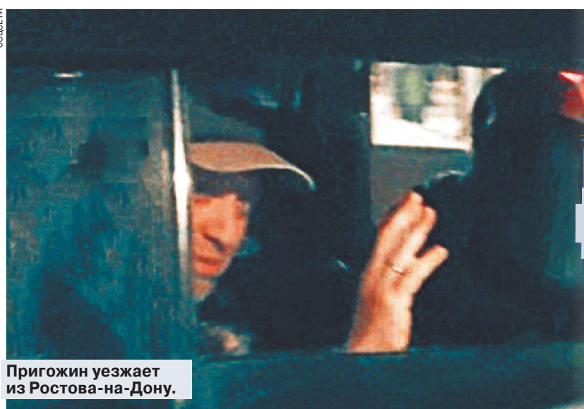
Пригожин уезжает из Ростова-на-Дону.