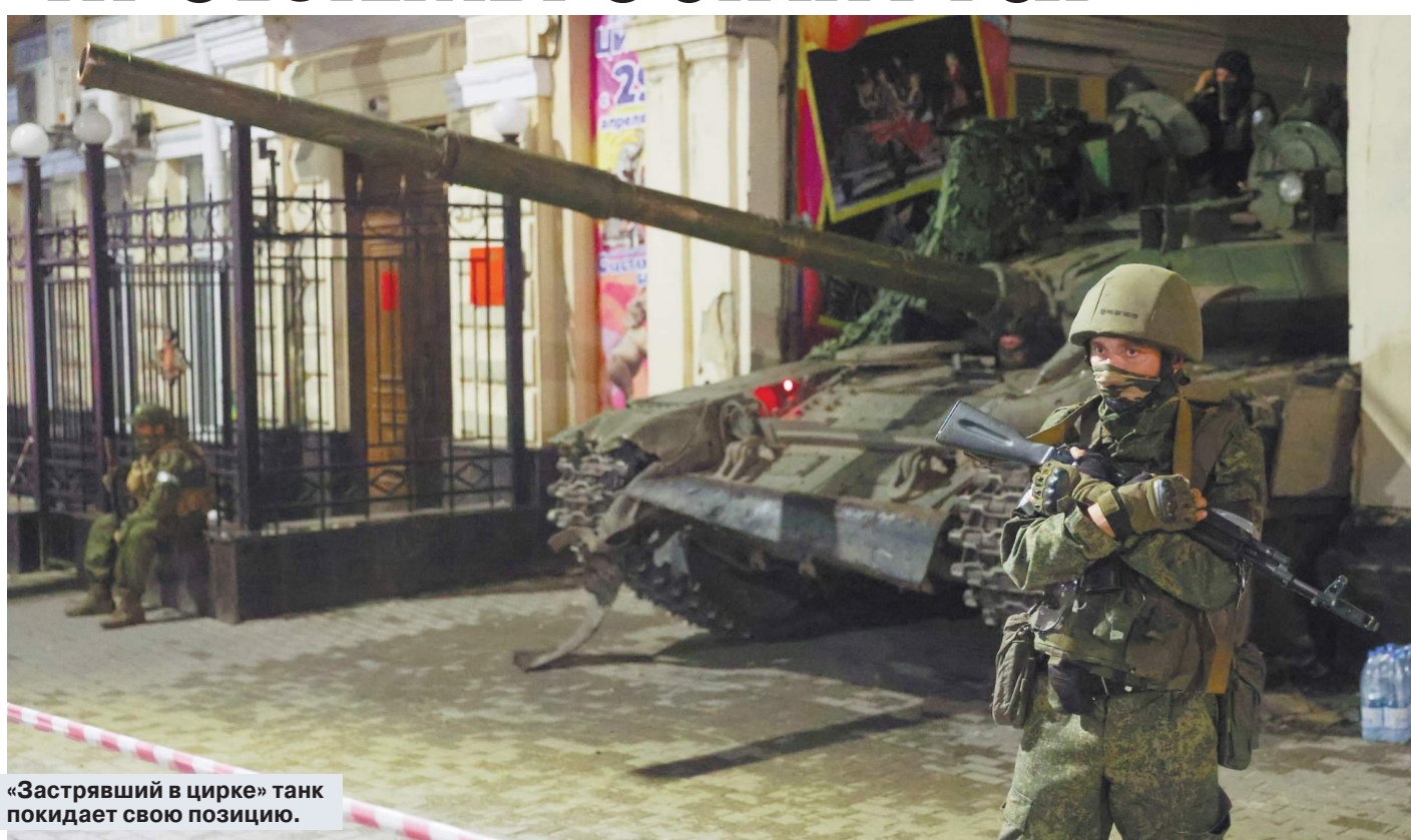
«Застывший в цирке» танк покидает свою позицию.

Россия показала свою уязвимость — и всему миру, и самой себе