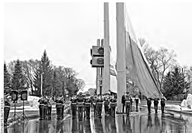
Полотна реют на участке улицы Димитрова, у выезда на мост через реку Бирю.