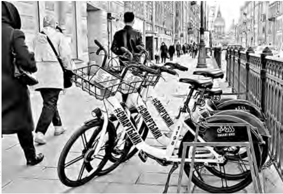
Петербургцев электровелосипедами уже не удивить.

В Санкт-Петербурге начинает работу новый сервис аренды электровелосипедов. В Петербурге парк электровелосипедов составит 1,5 тысячи, в Подмоковье — 2,5 тысячи единиц. Инвестиции компании в проект оцениваются примерно в 480 миллионов рублей.