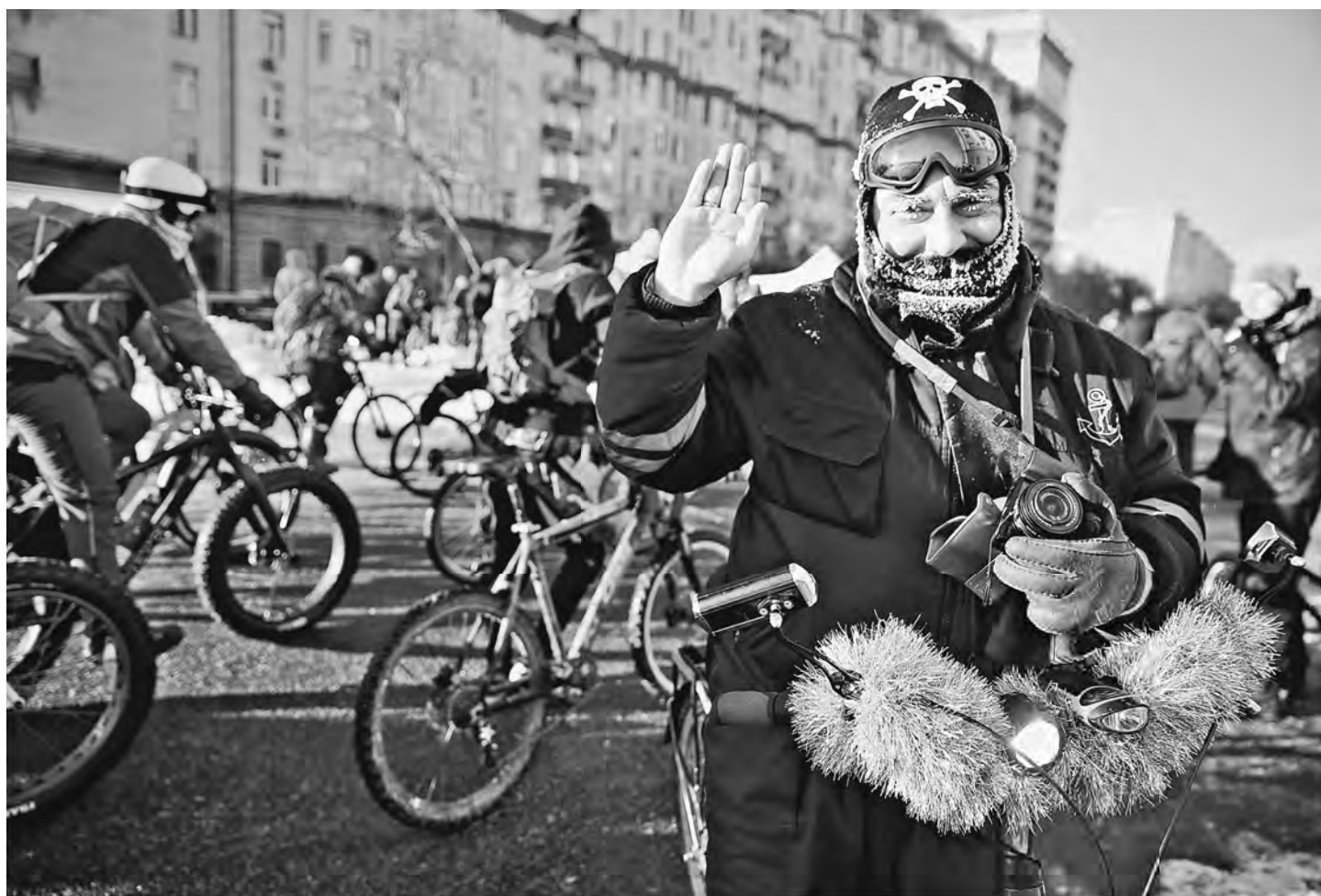
Серьезные морозы не остановили участников вчерашнего московского велопарада.