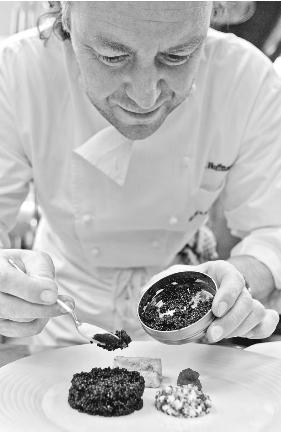
Новые правила продажи рыбных деликатесов помогут нам быстро отличить настоящую черную и красную икру от подделки. Не скроешь теперь под красивой упаковкой и рыбу, напичканную антибиотиками.